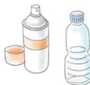
缶・ペットボトル