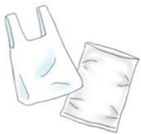
ビニール・ポリ袋