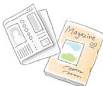
新聞・雑誌・紙類