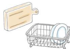
まな板・食器かご